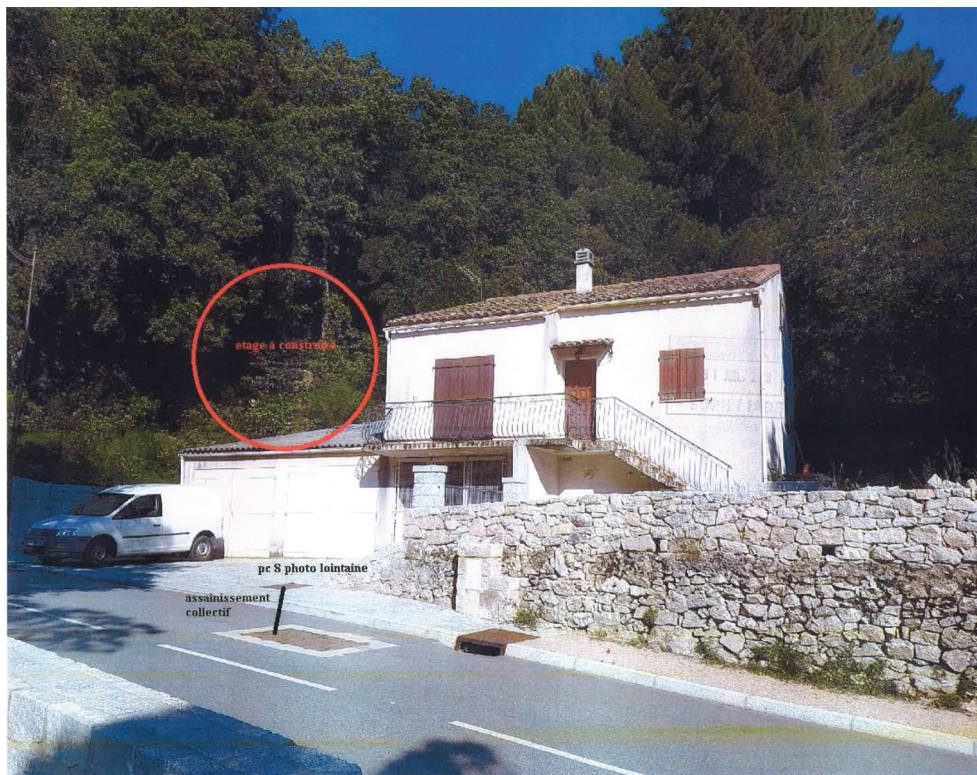
Construction existante et projet d'implantation

En complément de cet atelier, le projet d'un point de vente directement implanté sur la propriété permettra à l'éleveur de développer un circuit de commercialisation court. En effet, la création d'un point de vente juxtaposé à l'atelier semble primordiale afin de mettre en valeur des produits de l'exploitation.