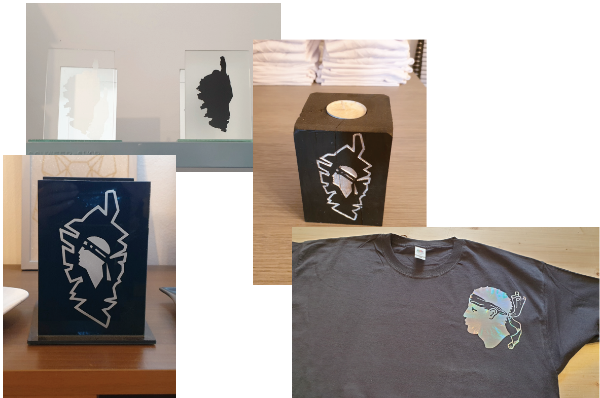
Exemples de produits réalisés grâce au projet

Les supports sont indispensables au développement d'une gamme de produits qualitative