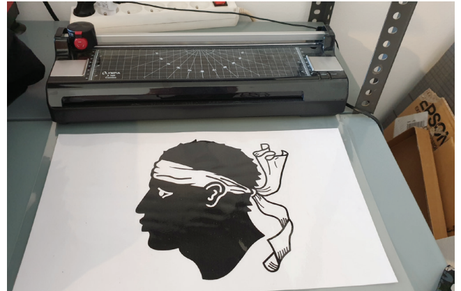
Travaux utilisant la technique de la sublimation