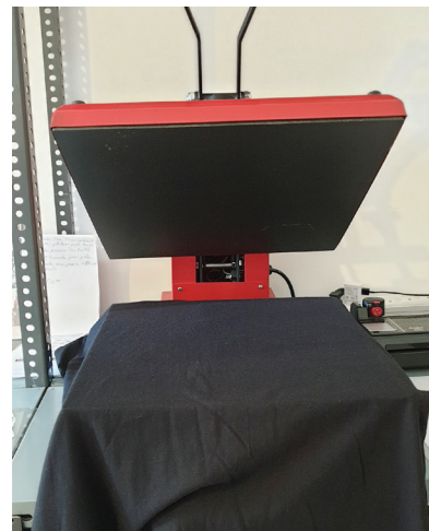
Presse permettant le marquage des produits.